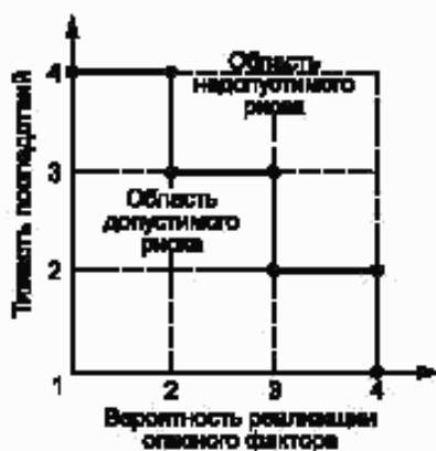
Рисунок Б.1 — Диаграмма анализа рисков

Если точка лежит на или выше границы — фактор учитывают, если ниже — не учитывают.